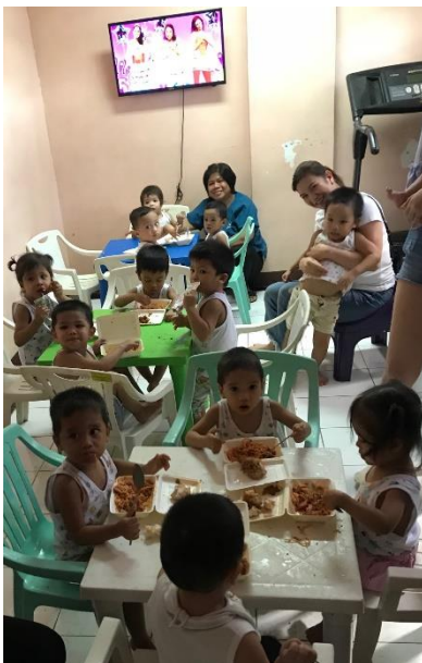
Le groupe des "grands" au repas de midi