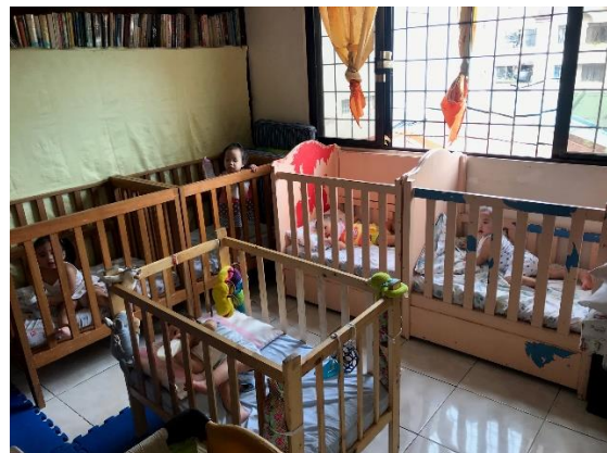
Le groupe de "petits" dans leurs crèches